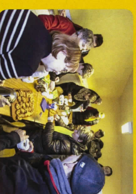
L'accueil festif et chaleureux qui réconforte les nombreux participants aux 66 km du parcours