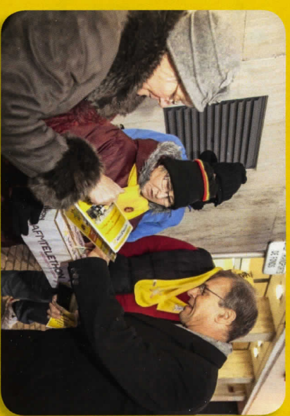
Premier don de la Journée... avec documentation à l'appui !