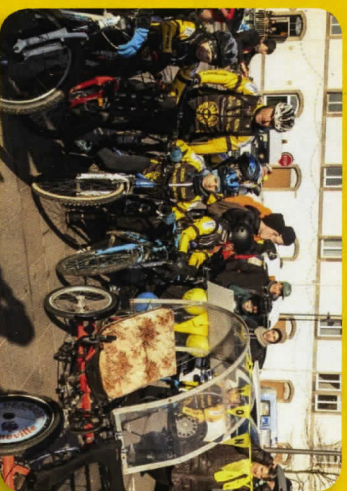
Une jeunesse dynamique et bien motivée par le TÉLÉTHON !