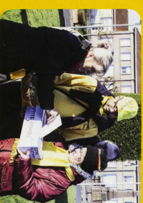
Beaucoup d'application de la part des donateurs et des détenteurs de la collecte pour le TÉLÉTHON !