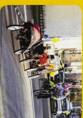
Les bénévoles sur les vélos couchés encore et toujours dans l'action