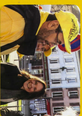
La bonne humeur et la chaleur humaine toujours de mise à Baccarat