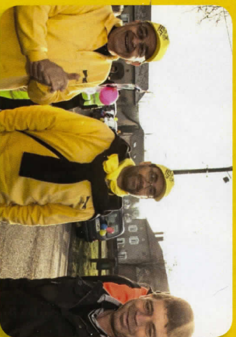
Burville toujours aussi fidèle, et la relève est assurée entre l'ancien et le nouveau président de Handisport !